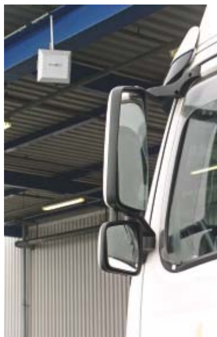
Bild 4 An den meisten Be- und Entladestellen in Dingolfing kommunizieren die Speditionen mit der DLSS-Leitstelle aber bereits über RFID mit im Fahrzeug installierten aktiven Transpondern.

mieren und in gewissem Maße auch noch Einfluss auf diese nehmen können. Bereits während der ersten Prozessentwicklung wurden die beteiligten Spediteure in die Diskussion mit eingebunden, sodass man gemeinsam Zeitfenster gefunden hat, die zu einem Gesamtoptimum führen. Sämtliche Lkw mit ihren Statusmeldungen sind für alle