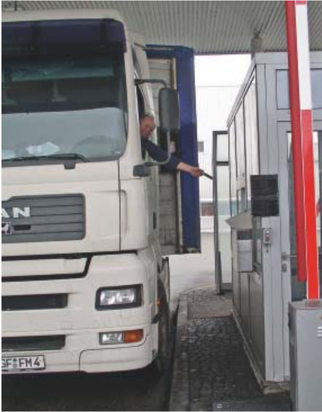
Bild 5 Bei Werksausfahrt wirft der Lkw-Fahrer den Transponder in die dafür vorgesehene Rückgabebox.