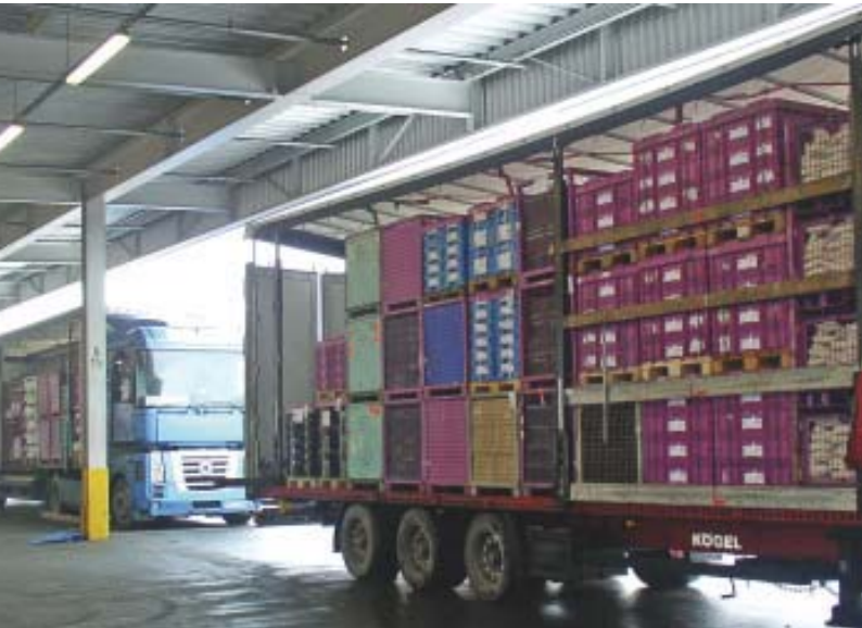
Bild 2 Koordinierte Be- und Entladevorgänge und eine gleichmäßige Auslastung der einzelnen Stationen sind heute bei BMW die Regel.