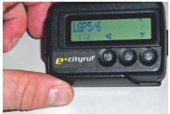
Bild 7 Der Pager des Lkw-Fahrers zeigt an, welchen Platz er auf dem BMW Werksgelände anfahren soll.

Der Bereich Systeme Logistik der Inform GmbH, Aachen, disponiert zeitkritische Transporte und optimiert Logistikabläufe in Echtzeit. Die Systeme werden im innerbetrieblichen Transport, im Lager, in Häfen und Umschlagzentren, im HealthCare-Bereich sowie im Straßengüterverkehr und in der Baustofflogistik sehr erfolgreich eingesetzt. Seit mehr als 20 Jahren spezialisiert sich ein Team von Wirtschaftsingenieuren, Informatikern, Betriebswirten, Naturwissenschaftlern und Programmierern im Geschäftsbereich Systeme Logistik auf die Realisierung der Projekte. Heute werden die Anwendungen „SyncroTESS“ und „SyncroSupply“ in mehr als 100 Installationen weltweit erfolgreich eingesetzt und haben sich in Großunternehmen sowie auch in Unternehmen mittlerer Größe aus den unterschiedlichen Branchen bewährt.