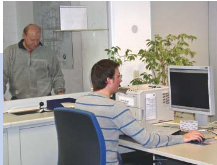
Bild 3 Die DLSS-Leitstelle koordiniert sämtliche internen und externen Lkw-Verkehre im BMW Werk Dingolfing.