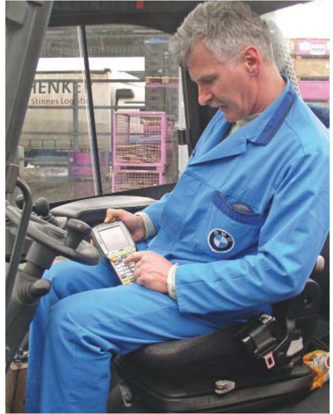
Bild 6 Der Staplerfahrer nimmt mit seinem MDE-Gerät Kontakt zu dem Lkw-Fahrer auf dem Lkw-Wartepplatz auf.